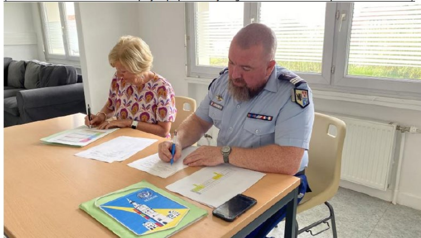
Une convention a été signée entre la gendarmerie et l'association.

(/1493019/article/2024-08-16/un-projet-qui-pu-voir-le-jour-grace-l-association-soroptimist-international)