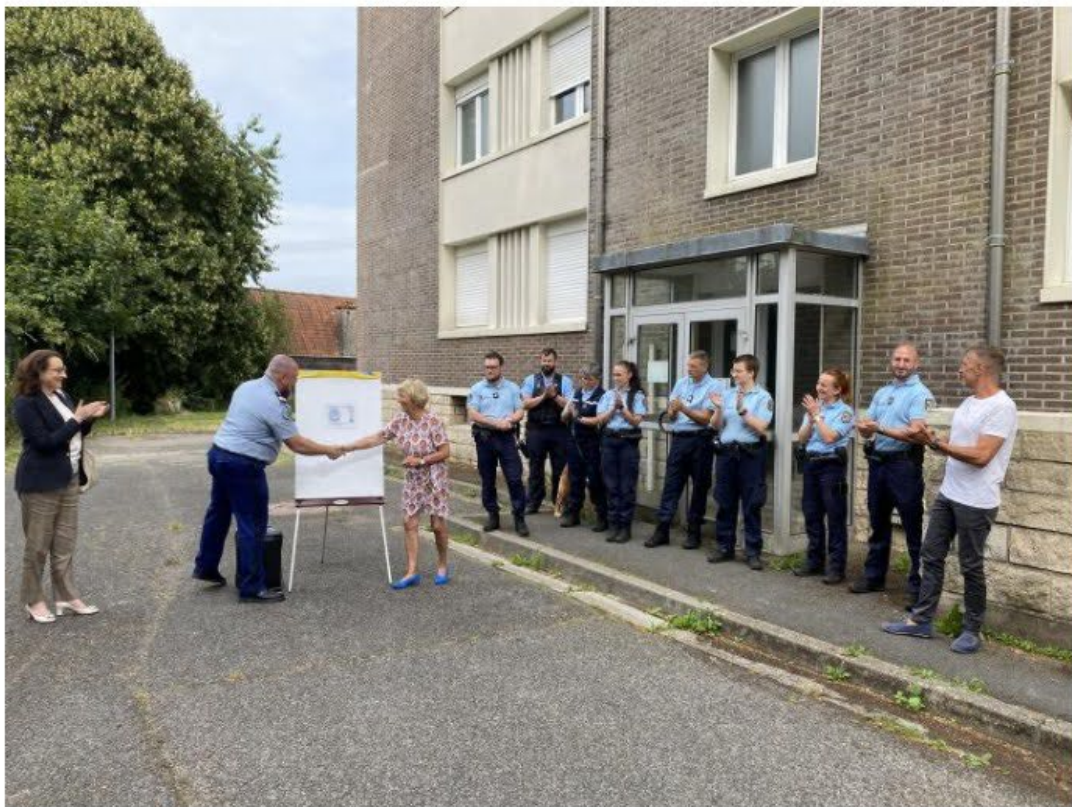
L'espace Mélanie a été inauguré mardi.