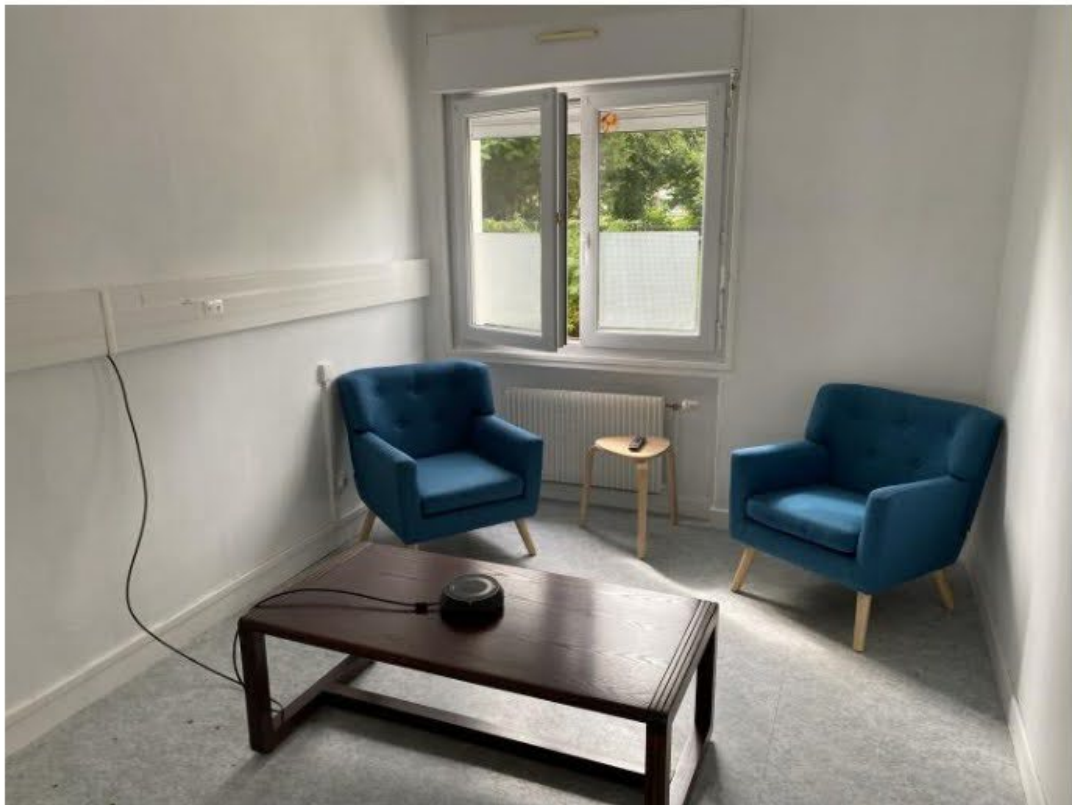
La salle d'audition.